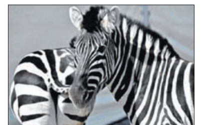
Zebras im Zirkus sind immer ein Blickfang.