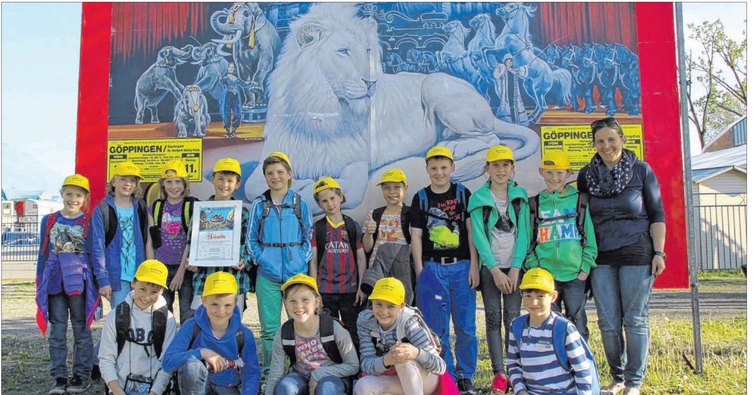
Die Schüler der Klasse 4 der Grundschule Ebersbach-Bünzwangen waren in der Zirkusstadt des Zirkus Krone im Stauferpark. Dort machten sie eine Zirkusrallye und besuchten anschließend eine der Vorstellungen.