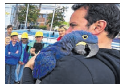
Der blaue Papagei kann singen.