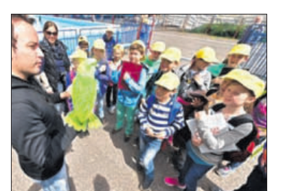
Neugierige Schüler bei der Zirkusrallye.