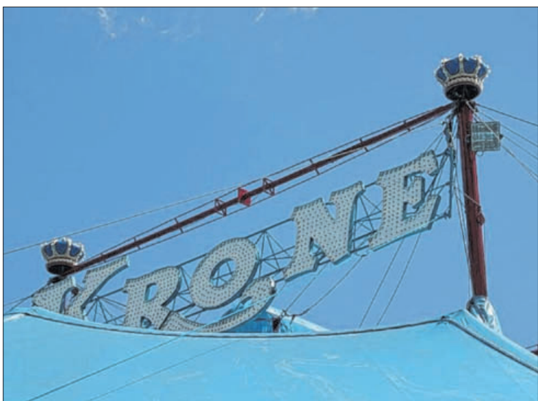
Das größte Zelt der Welt in Zahlen: Höhe: 24 Meter (innen 16 Meter) Gesamtfläche: fast so groß wie ein Fußballfeld; Plätze: 4000; Aufbau: 60 Personen bauen das Zelt in sechs Stunden auf und in drei Stunden ab; Zeltmeister: Andon Kirov; Beleuchtung Schriftzug: 999 Lämpchen; Außentreppen: elf Stufen.