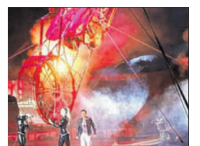
Spannung auf dem Todesrad.