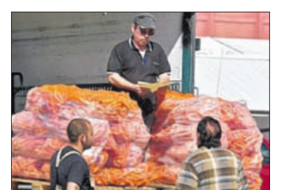
Karotten für die Tiere.