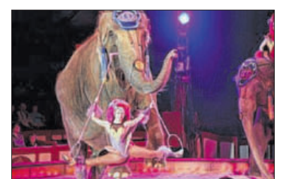
Akrobatik mit Elefanten.